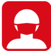
マスクを 着用してください