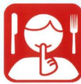
食事中はご着席いただき 会話はお控えください