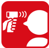
入場前の検温に ご協力ください