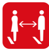
社会的距離 (できるだけ2m、最低1m)を 保つようしてください