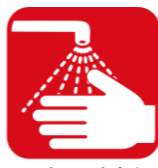
手洗い、消毒を こまめにしましょう