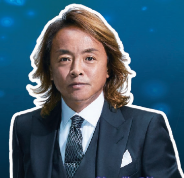
大会アンバサダー 元サッカー日本代表 北澤豪さん